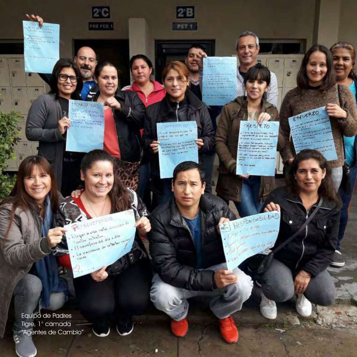
Equipo de Padres Tigre, 1° camada "Agentes de Cambio"